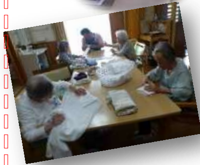
*みんなで洗濯物の片づけ