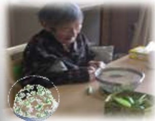
*夕ご飯は豆ご飯かな～♪