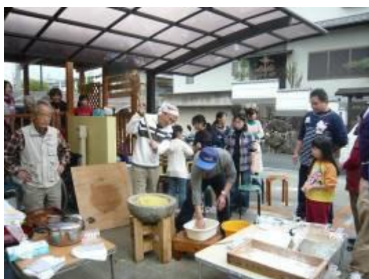
子供会と餅つき大会