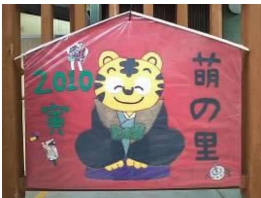
萌の里玄関の絵馬