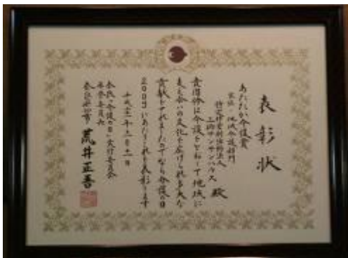
あたたか介護賞の表彰状

昨年11月11日の介護の日に奈良県は介護に携わる個人や団体10組を顕彰しました。脳卒中で失語症になった方々の合唱によるリハビリ活動はじめ認知症や障害者の方や家族を支える活動、夜間の訪問看護・訪問介護従事者などの素晴らしい献身的な活動と一緒に私たち三郷サンサンハウスも表彰されました。