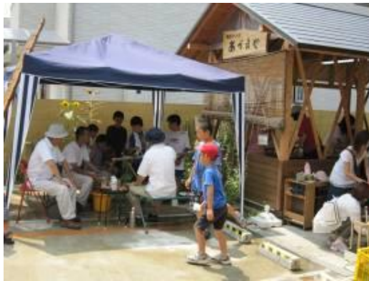
三室子ども会と流しそうめん

7月31日（土）に三室納涼祭があり萌の里も参加致しました。今年はお祭りらしく一円玉落としのゲームも取り入れてちいろば園ドンキーのお菓子を販売させて頂きました。ご近所の利用者さんがご家族と手伝って下さり大変助かったのですが、いつもとは違う利用者さんの生き活きとした表情がとても印象的でした。本番前に職員と利用者さんとで盆踊りの練習に参加させて頂いていた成果（？）も少しは発揮でき楽しいお祭りでした。