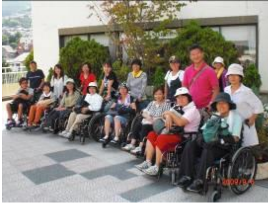
近鉄生駒駅周辺にて