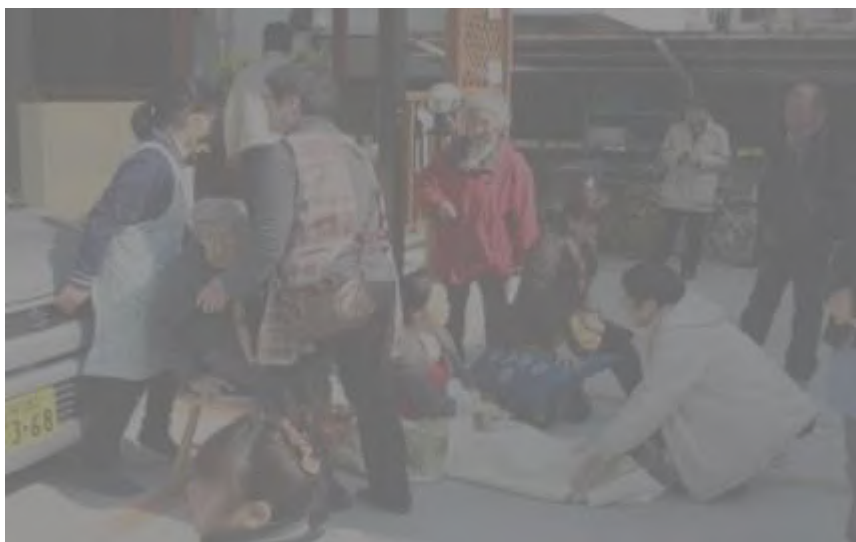
三室の地域の協力で避難訓練

の里の課題を抑えなおす作業になったようです。以前研修で聞いた言葉に“何回会議をしたかよりも何回飲んだかの方が理解しあえる”と聞いた事があります。いつかそんな時間を持てたらいいのになあ…って思いますが、これだけの人数の職員がいても、24 時間支えるシフトをまわすので四苦八苦しているのが現実です。