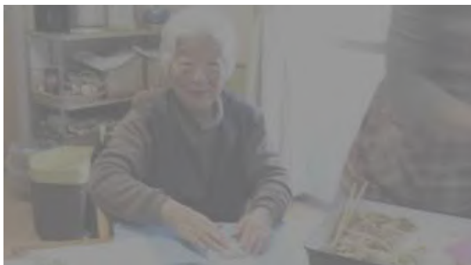
利用者さんと一緒に春巻きを作ってお昼の準備

現在、萌の里所属の職員はサンサンハウスの中でダントツに多い総勢 26 名おります。