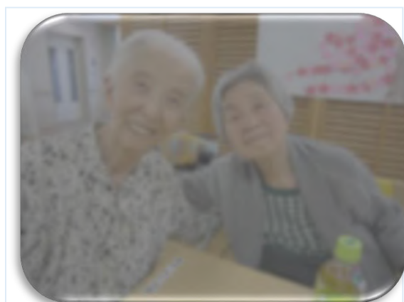
昨年引っ越した友人と再会