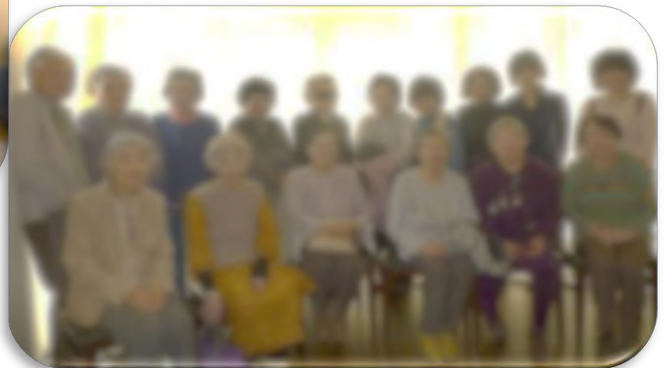
イルカフェ モリタにて記念写真パチリ