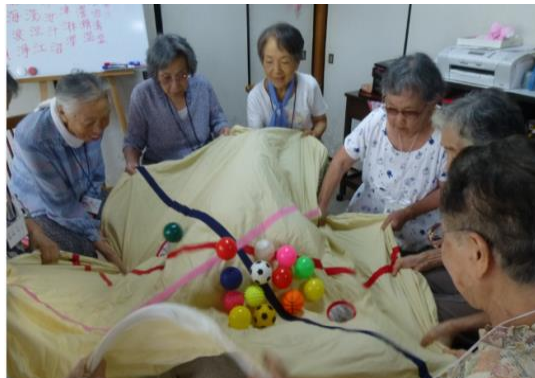
サンサン体操 玉入れゲーム

最近、皆さん年齢的に手の込んだ小物作りは少なくなりましたが、Aさんは、ひ孫さんの為に猫のポーチを一生懸命作っていらっしやいます。5人のひ孫さん一人一人にひいおばあちゃんが手作りするって素