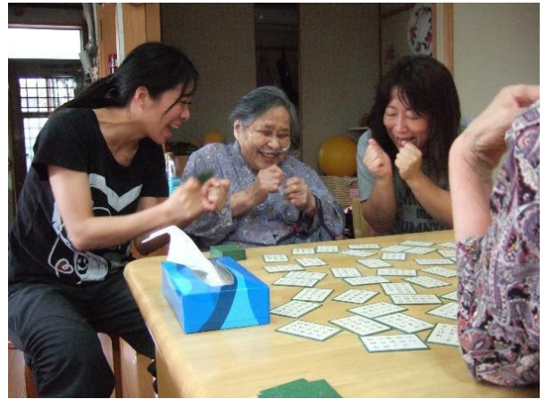
百人一首 ガンバルゾー！！

4月の介護保険の改訂で、デイサービスの職員がお家の中まで入って準備のお手伝いをしたり、お送りした時にお部屋まで行ってお手伝いしたりするのが通所介護に含んでも良いことになりました（時間の限度はありますが）。あかねの里では以前から、必要な方には家の中でのお手伝いをしていたのですが、デイサービスでは送迎時からすでに介護がスタートしていて、そ