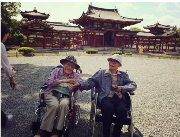
101歳と96歳 日帰り旅行OK!