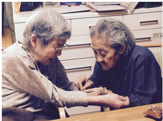
ほころびてんのん?! よっしゃ!