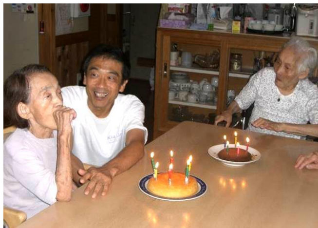
あわせて177歳の誕生祝い

そんな暑い真ただ中、Nさんが8月5日に91歳、Kさんが8月10日に86歳の誕生日を迎えられ、みんなでささやかなお祝いをしました。