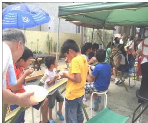
流しそうめん 好評です(^)/