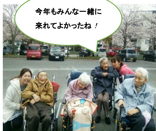
あかねの美人?4姉妹