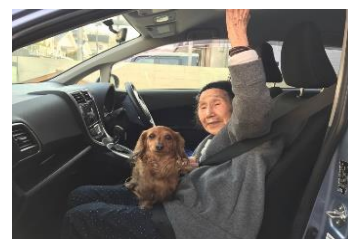
ポンちゃんも送迎にGO-!

小規模多機能ホーム萌の里は地域の中で地域と共に、三室地域の皆さまに助けられながら歩んでいます。今ボランティアで、朝な夕なに犬の“ポンちゃんと散歩に行き隊”で小学生の女の子、中学生のお兄ちゃん、ご近所の沢山の方々が来てくださっています。又、調理、おばあちゃんの駄菓子屋にもボランティアでお手伝い頂いています。本当にありがとうございます。嬉しい限りです。