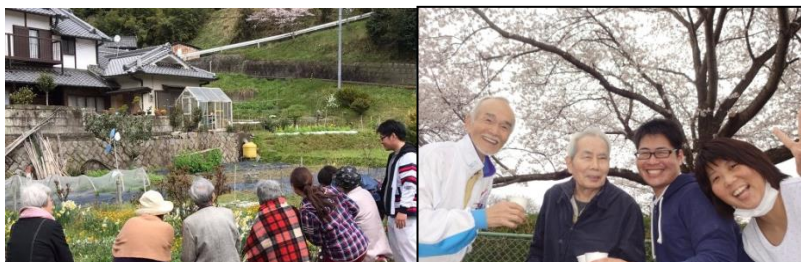
楽しみの一つ桜の花見も 花壇の花見も 楽しい(^)/ うれしい♡

「つり橋を 見事みなさま 渡り終う 渡れぬわたし こころゆらゆら」と短歌に歩けなかった時の気持ちを込めてくださいました。あれから一年たち、今年はとっくり湖の回りを皆さまと一緒に歩けるようになったことをとても喜ばれていました。散策しながら、「昨年はそんな短歌を詠んだね」と話され私たちも懐かしく思い出しました。様々な身体状況の変化はありますが、少し外に出る事から始めて、少しでも自分がうれしい楽しいと思える時間を過ごして頂きたいと思います。この時期になると、スタッフが通勤途中や私用で出かけた時、馬見公園このくらい咲いているよ、ここも満開よと写真を送ってくれます。皆さまとのお出かけすることに想いを馳せて、スタッフにとっても楽しみになっていることを嬉しく思っています。