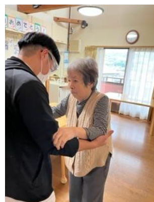
機能訓練士の指導

リハビリやマッサージの先生に来て頂き体のことを相談しながら積極的に体を使うという意識が続くよう私たち職員も手助けをし、転倒や事故のないよう見守っています。