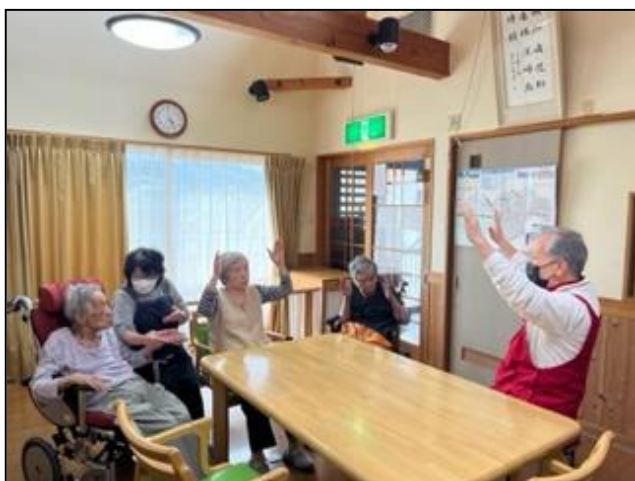
みなそれぞれ 楽しくたいそう

少しずつ以前の生活に戻りつつある日常ですがマスクを外し笑顔で話せる日が一日でも早く来てほしいと願っています。外出が難しい中、共同住宅では少しでも体を動かし足の運動や座って出来る体操をしています。