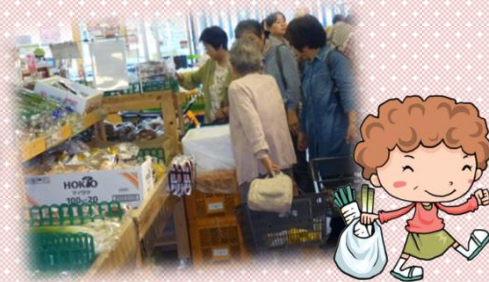
*「よってって」で買物

法隆寺の近所に布穀菌はあります。あいにくの雨でしたが、赤膚焼きの器に盛られた斑鳩名物・竜田揚げランチを頂きました。昼食後、産直市場「よってって」で買物タイム。新鮮な季節の野菜・果物など色々とお買物しました。