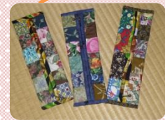
*パッチワークの筆入れ