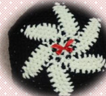
*靴下の輪っかのマット